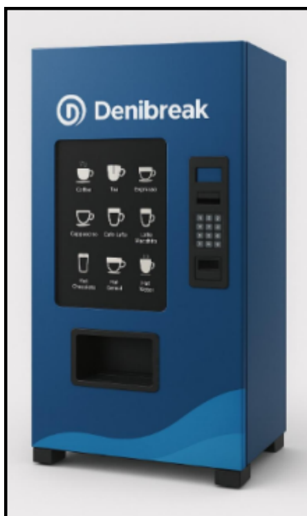
DISTRIBUTORE AUTOMATICO MONVISO