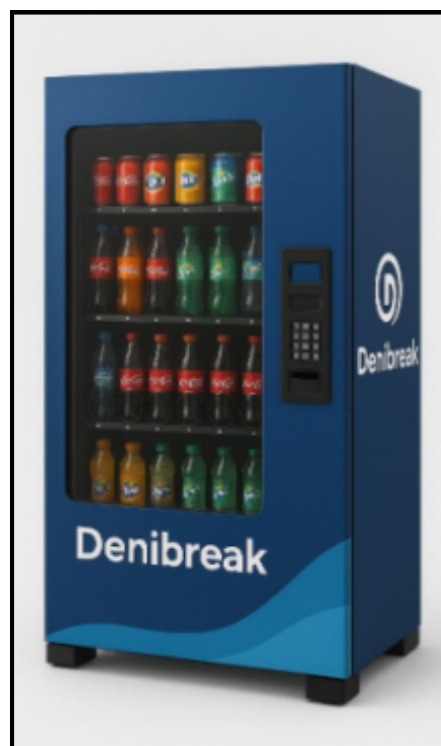
DISTRIBUTORE AUTOMATICO REFRIGERATO NAVIGATOR

Le nostre macchine sono dotate di sistemi di pagamento tramite contanti, chiavetta e contactless.