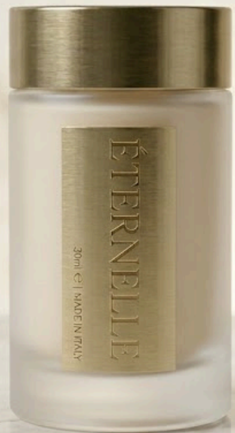
ÉTERNELLE - Crema Anti-Age 3D