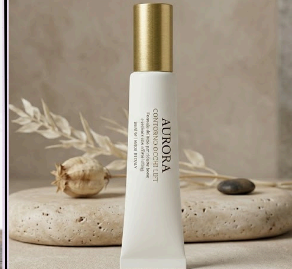
AURORA - Contorno Occhi Lift