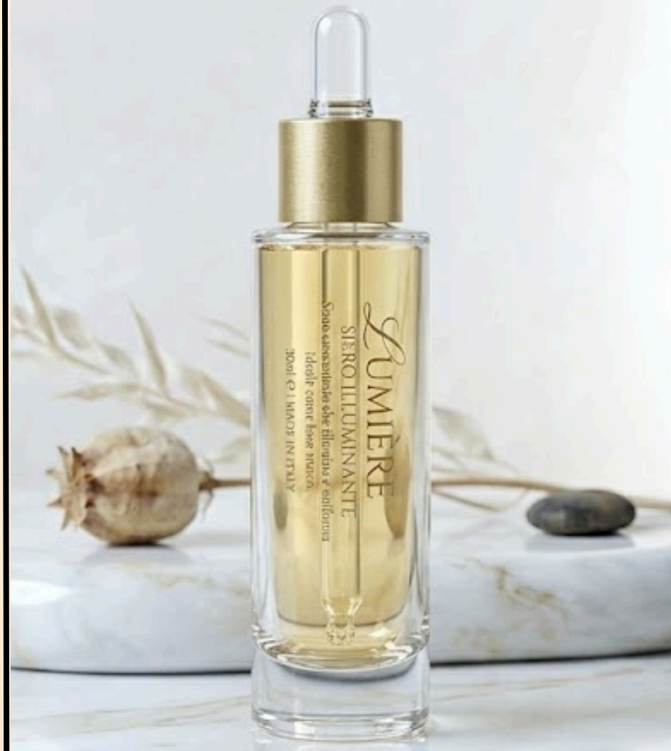
LUMIÈRE - Siero Illuminante