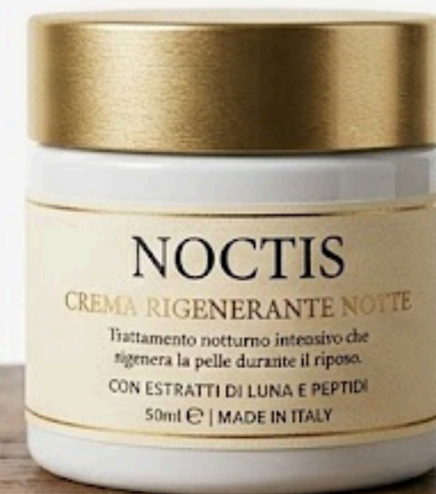
NOCTIS - Crema Rigenerante Notte