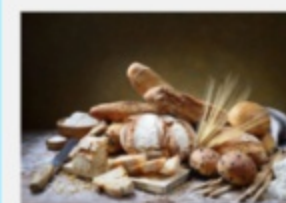
Prodotti da forno 645353355