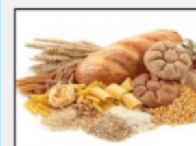
Cereali e derivati 12677566