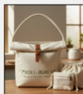
Busta S - Organic Flex €9,80 SKU1002