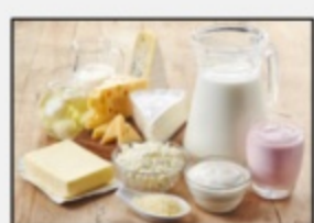
Latticini e sostituti 964264