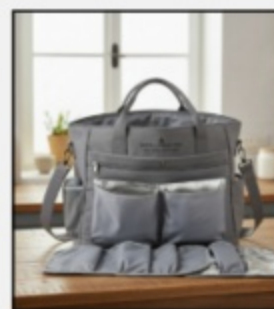
Busta L - Family Pro €22,00 SKU1004