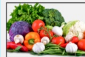
Verdura fresca di stagione 136257