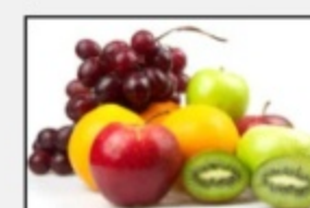
Frutta fresca di stagione 123122