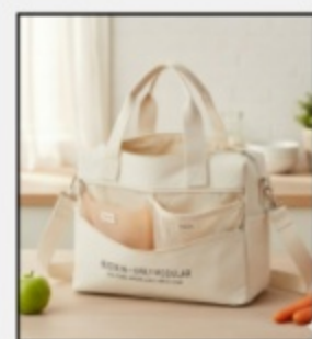
Busta M - Family Modular €14,50 SKU1003