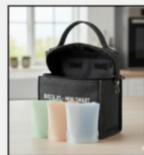
Busta XS - Mini Smart €6,50 SKU1001