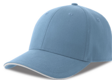
LIBERTY SANDWICH-S 20,00€