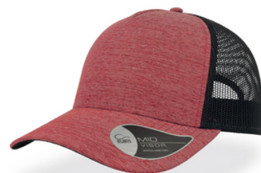
RAPPER MELANGE 18,00€