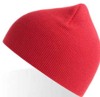
KID YALA 15,00€