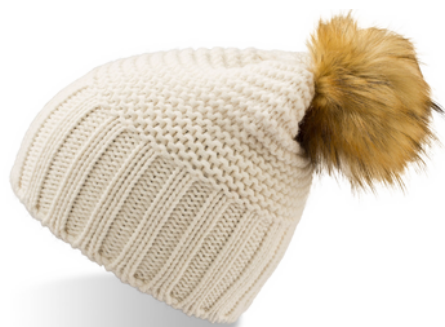
MONTE BIANCO 21,00€