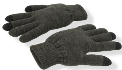
GLOVES TOUCH 10,00€