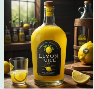
Succo di limone bio 250 ml €1,70