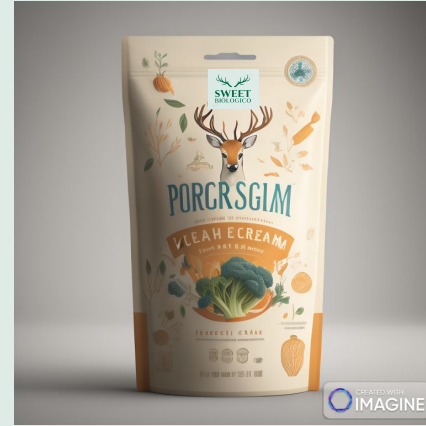
Vellutata di verdure bio 500 g €3,95