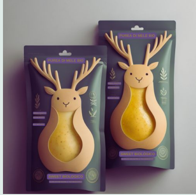
Purea di pera bio 100 g €0,93

Codice commercio all'ingrosso di altri prodotti alimentari 46.38.90