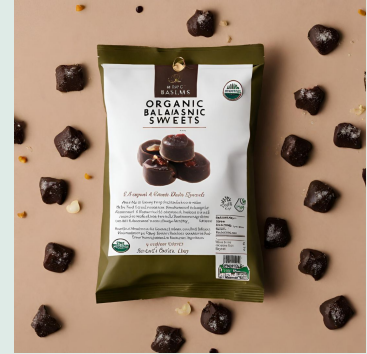
Caramelle balsamiche bio