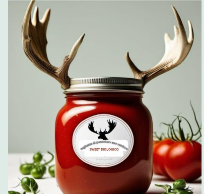
Sughetto di pomodoro con verdure bio-2 vasetti 160 g €2,50