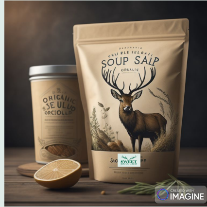
Zuppa di farro bio 400 g €2,89