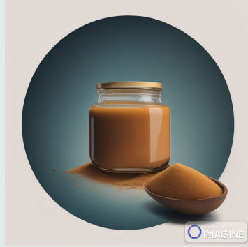
Crema di nocciole spalmabile biologica 180 g €4,30