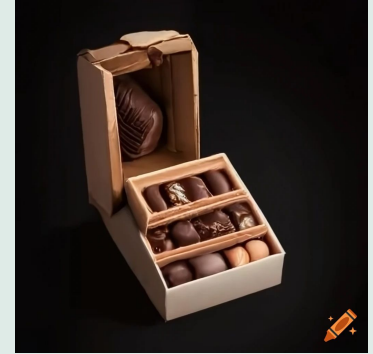
Cioccolato al latte 36% con nocciole intere biologiche 100 g €3,10