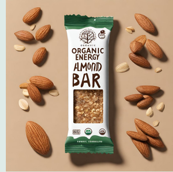
Barretta al farro e mandorle bio