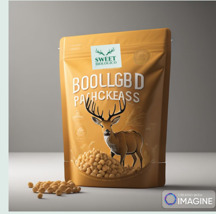
Ceci lessati bio 300 g €2,12