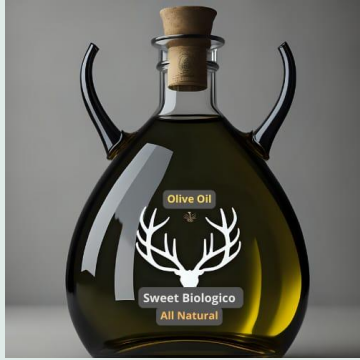
Olio extra vergine bio 750 ml €11,00