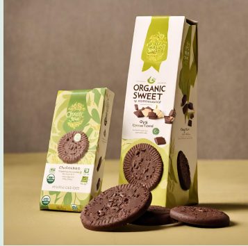
Frollini di grano con con gocce di cioccolato

Codice commercio all'ingrosso di zuccheri,cioccolato,dolciumi e prodotti da forno 46.36.00