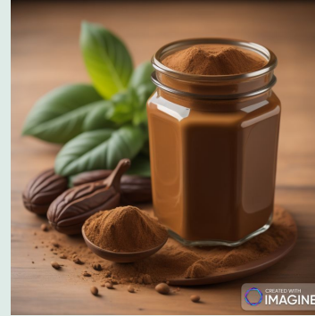
Crema biologica al cacao con legumi 210 g €3,55