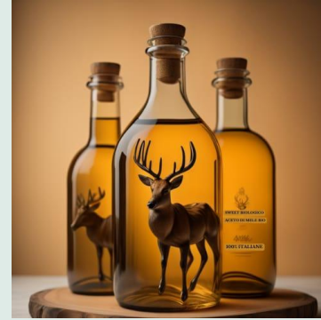
Aceto di mele bio 500 ml €2,15