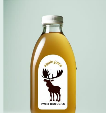
Succo di mela baby bio 200 ml €2,08