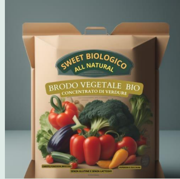
Brodo vegetale granulare bio 120 g €2,10