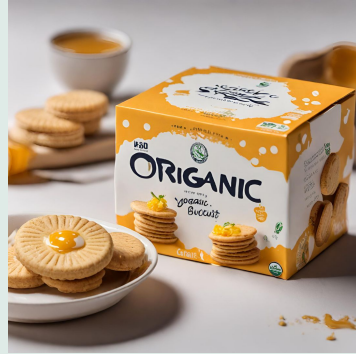
Frollini con yogurt e miele