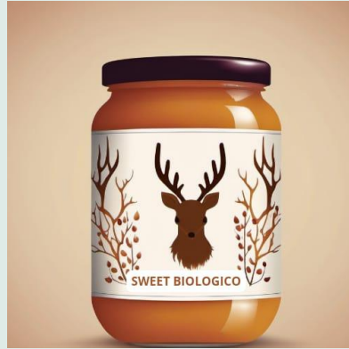
Omogeneizzato di tacchino bio 160 g €2,62