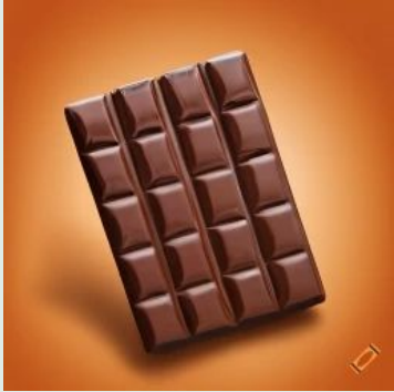
Cioccolato extra fondente 75% biologico 100 g €2,85

Codice commercio all'ingrosso di zuccheri,cioccolato,dolciumi e prodotti da forno 46.36.00