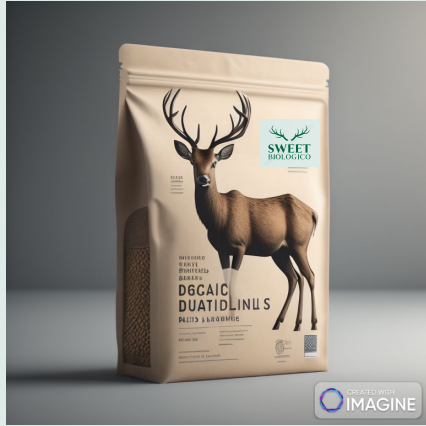
Lenticchie secche bio 400 g €3,69

Codice commercio all'ingrosso di cereali e legumi secchi 46.21.10