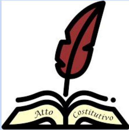
TABELLA A (art. 1, comma 1)

L'anno 2023 , il giorno 05 del mese di dic in Imperia inanzi a me notaio in Imperia con sede in Imperia è/sono presente/i il/i signore/i ..... cognome, nome, data, luogo di nascita, domicilio, cittadinanza ), della cui identità personale ed età anagrafica io notaio sono certo.