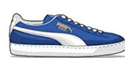
Puma Suede/Clyde - 1973 Tribute to Basketball Player Walter "Clyde" Frazier