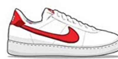
Nike Bruin - 1972 Played a vital role in Nike's basketball shoe history

La scelta della "b" e della "e" minuscole è stata pensata per mettere in risalto la parola "sneakers" che identifica il prodotto che offriamo.