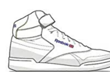
Reebok Ex-O-Fit - 1982 First athletic sneaker designed for women