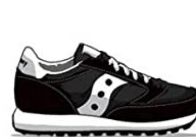
Saucony Jazz - 1981 The most epic shoe of Saucony