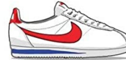
Nike Cortez - 1972 The first track shoe created by Nike