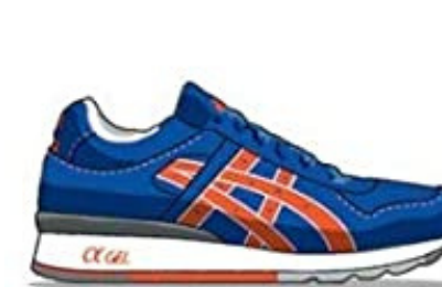
Asics GT-II - 1986 First model from Asics to feature the Gel technology