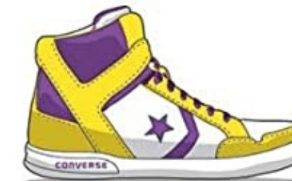
Converse Weapon - 1986 Tribute to Lakers Player Magic Johnson