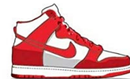
Nike Dunk - 1986 Loved by Basketball players and skateboarders