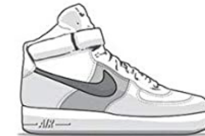
Nike Air Force 1 - 1982 Only available in white and grey at the beginning